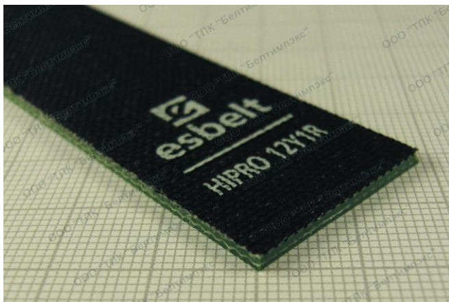
Фото профиля ленты: HIPRO 12Y1R