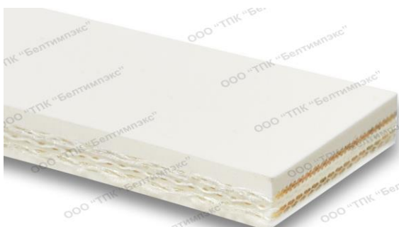
Фото профиля ленты: FEBOR 61CC