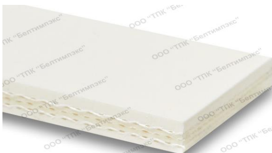
Фото профиля ленты: FEBOR 31CC