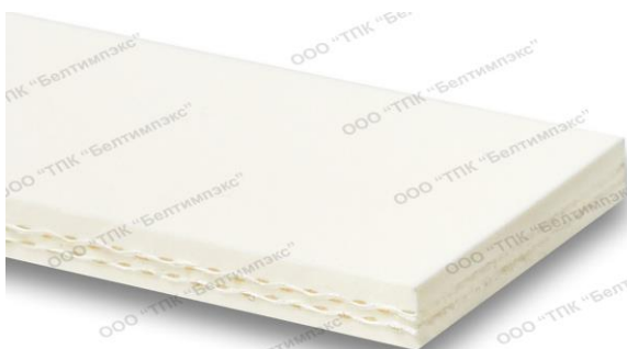
Фото профиля ленты: FEBOR 21CC